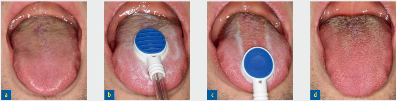
Abb. 2a-d: Professionelle Zungenreinigung mit dem TS1-Zungensauger step-by-step Abb. 2a: Herausstrecken der Zunge, Abb. 2b: Auftragen und Verteilen der Zungenpaste mit der Noppen-Seite, Abb. 2c: Absaugen des gelösten Biofilms mit der Lamellen-Seite, Abb. 2d: Ergebnis der professionellen Zungenreinigung

Bei einer Halitosis mit extraoraler Ursache wird der Patient an einen entsprechenden Facharzt (Innere Medizin, Otorhinolaryngologie) überwiesen.